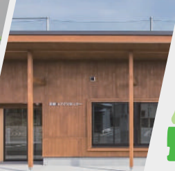
ワンストップ相談所 コミュニティづくり