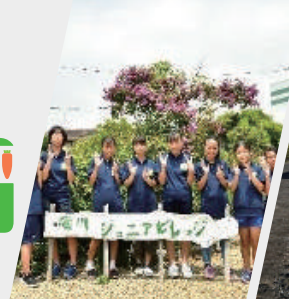
ジュニアビレッジ 起業家育成