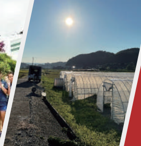
ニンジャトンネル 超低コスト&耐久